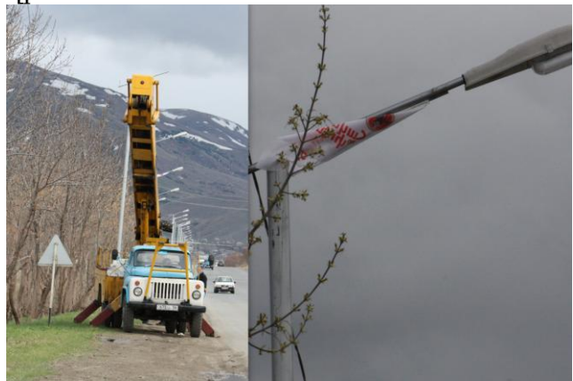
նկ. 12. ՀՀԿ դրոշի տեղադրում Վանաձոր Սպիտակ ճանապարհի էլեկտրասյուներին