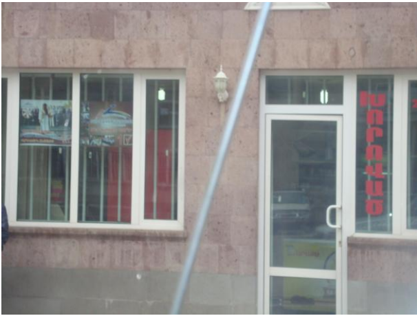
նկ. 9. հասարակական սննդի օբյեկտի վրա