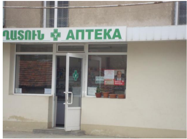
նկ. 10. հասարակական առևտրի օբյեկտի վրա