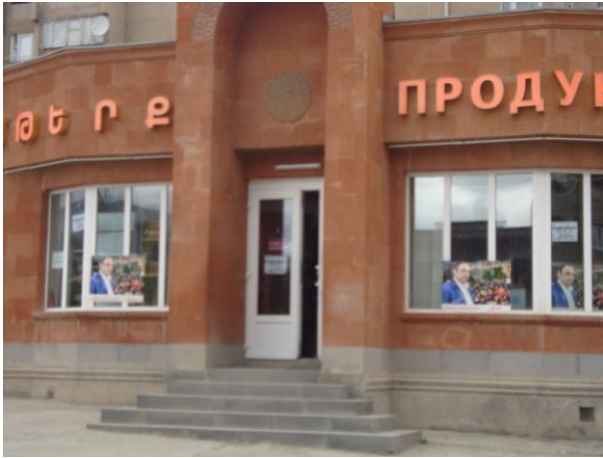
նկ. 1. հասարակական առևտրի օբյեկտի վրա