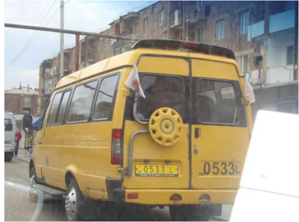
նկ. 8. հասարակական տրանսպորտի վրա