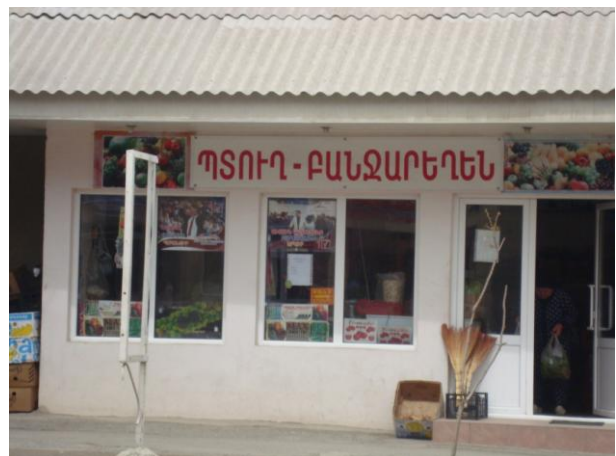
նկ. 6. հասարակական առևտրի օբյեկտի վրա