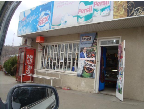
նկ. 3. հասարակական առևտրի օբյեկտի վրա