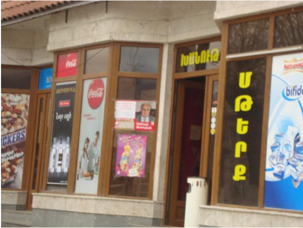
նկ. 7. հասարակական առևտրի օբյեկտի վրա