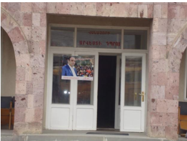
նկ. 5. պետական կրթական հատատության վրա