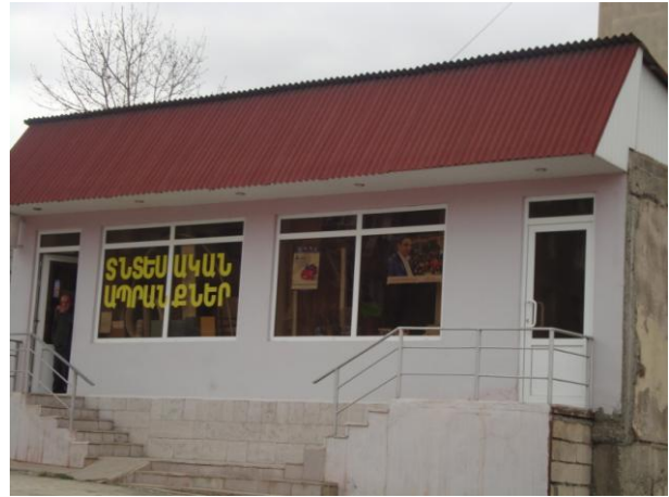
նկ. 2. հասարակական առևտրի օբյեկտի վրա