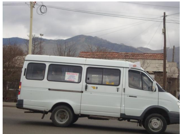
նկ. 4. հասարակական տրանսպորտի վրա