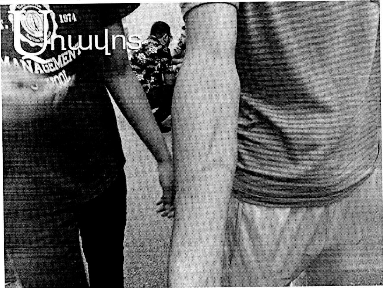
( http://www.aravot.am/wp-content/uploads/2015/07/cucarameri-vnasvacqner-4.jpg )